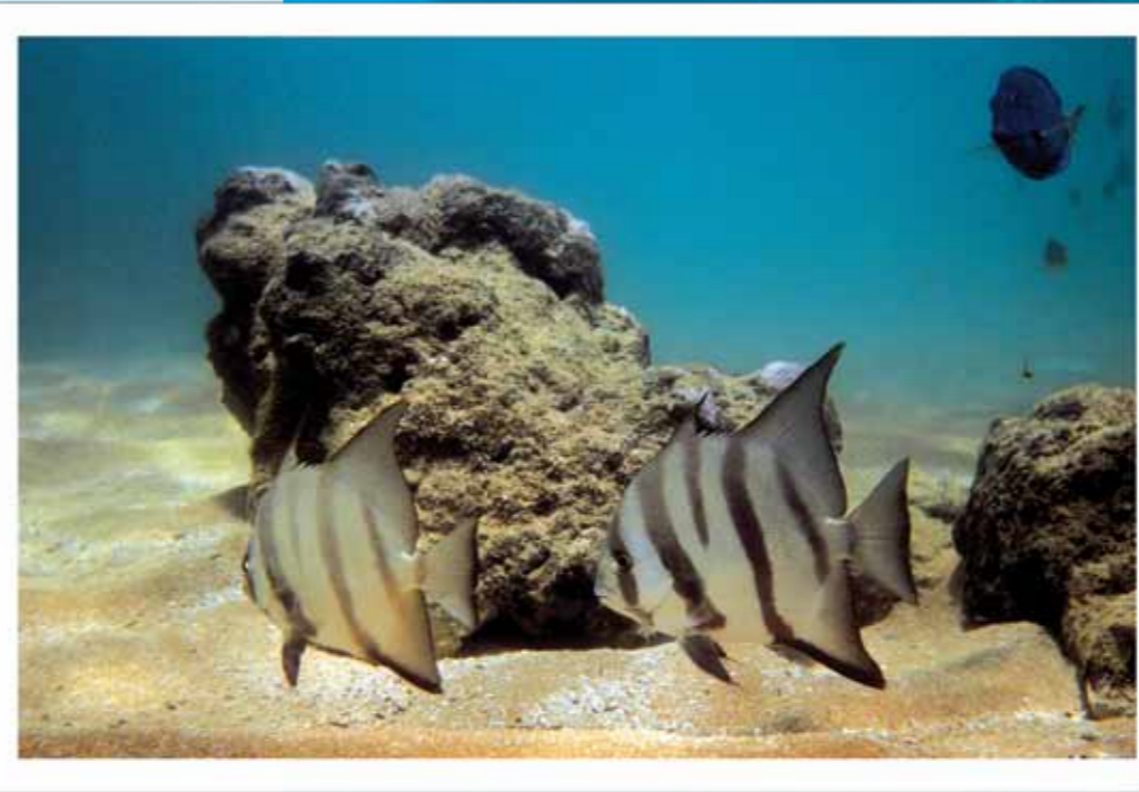
Área de Proteção Ambiental Costa dos Corais, PE e AL.